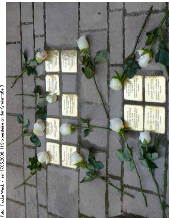
seit 1705,2008: 11 Stolpersteine an der Kyrnstraße 3

Zum Neuen Jahr sollen angesichts unwägbarer Zukunftsperspektiven landauf landab höchst interpretationsfähige Jahresprognosen Sicherheitsgefühle suggerieren. KARIN HEPPELLE fordert auf zum selbstverantwortlich-kritischen Umgang mit den Weisheiten aus dem Kaffeesatz.